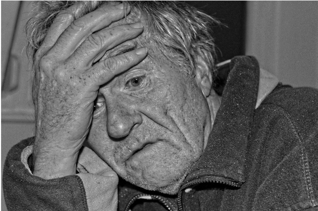
Abbildung 1: Ein demenziell veränderter Mensch